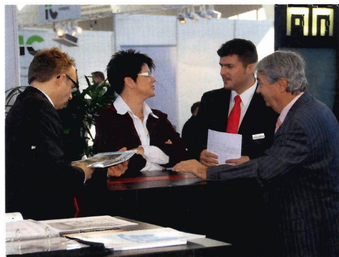
Knapp 1500 Interessierte fanden sich an zwei Tagen im Zürcher Messezentrum ein, um an der 5. FM-Messe teilzunehmen.