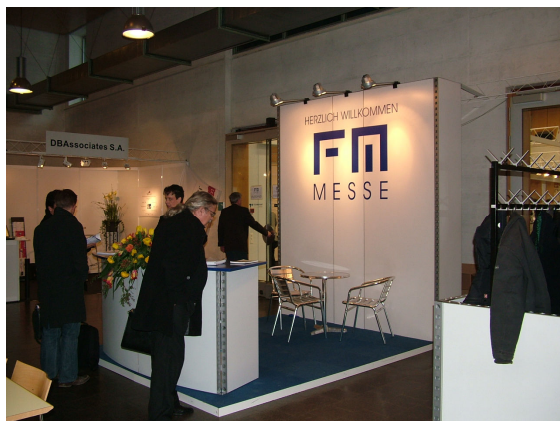
FM-MESSE 2004 im Technopark Zürich

Nachdem die erste professionelle Fachmesse der Schweiz im März 2004 für Besucher, Aussteller und Veranstalter ein durchschlagender Erfolg war, ist es kaum verwunderlich, dass die anstehende, zweite FM-MESSE im März 2005 schon jetzt nur anhand der bisherigen Ausstelleranmeldungen doppelt so gross wird.