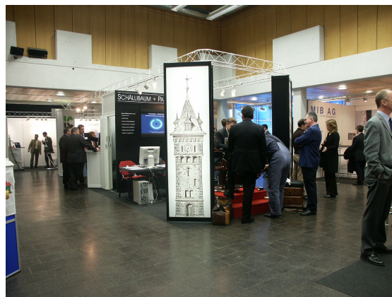
FM-MESSE 2004 im Technopark Zürich

Die Palette der Anbieter und Dienstleister reicht von Software-Firmen, FM-Service- und Gesamtdienstleistern über Planer bis zu Anbietern kaufmännischer bzw. technischer Infrastrukturen, und die Wahl der richtigen Strategie wird somit entscheidender. Die FM-MESSE 2005 hilft, einen Überblick über das sich explosionsartig vergrössernde Spektrum zu verschaffen, Kontakte zu knüpfen und Trends aufzuspüren. Angesprochen ist vor allem ein Fachpublikum, bestehend aus Bauherren, Architekten, Portfoliomangern, Investoren, Immobilienbewirtschaftlern und Unternehmern, aber auch all jene, die sich für den gesamten Lebenszyklus einer Immobilie interessieren, nicht zu vergessen Vertreter bauspezifischer Behörden.