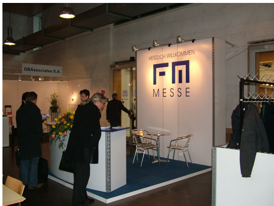
FM-MESSE 2004 im Technopark Zürich

Wen wundert es, dass die anstehende, zweite FM-MESSE im März 2005 bereits jetzt, gemessen an den bisher eingegangenen Ausstelleranmeldungen, doppelt so gross wird wie die letztjährige?