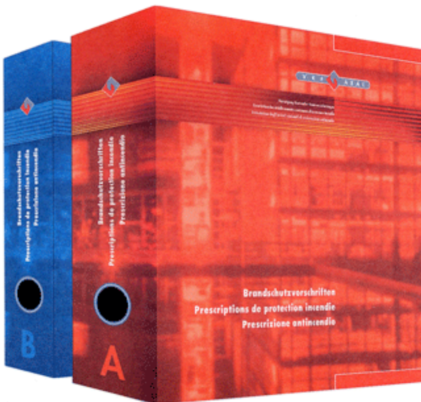
Farbige Ordner mit ab Januar 2005 neuen Vorschriften und Richtlinien der GVZ