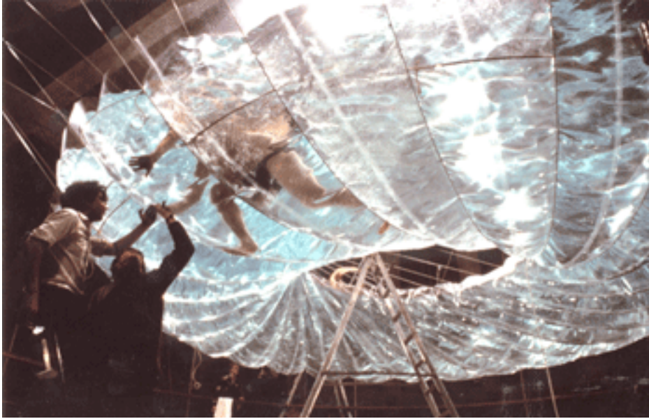
Wasserplastik in der Kuppel der ETH Zürich 1979/80, Jürg Altherr