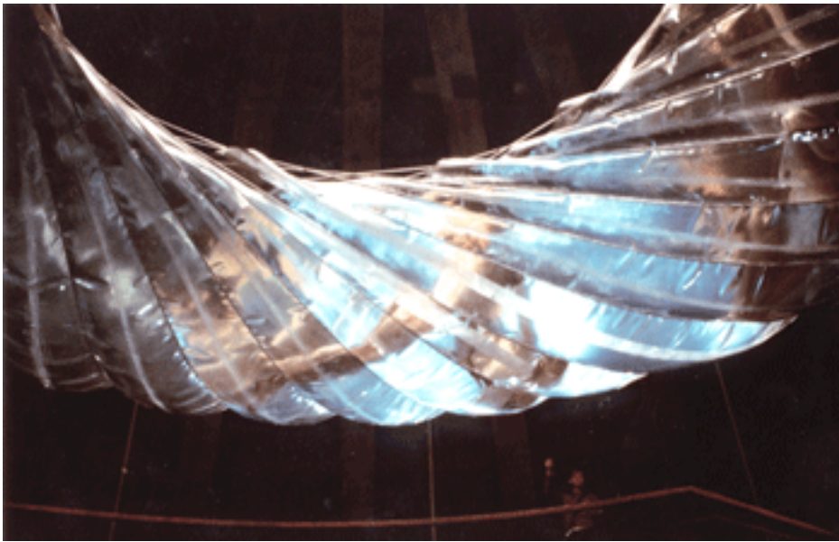
Wasserplastik in der Kuppel der ETH Zürich 1979/80, Jürg Altherr