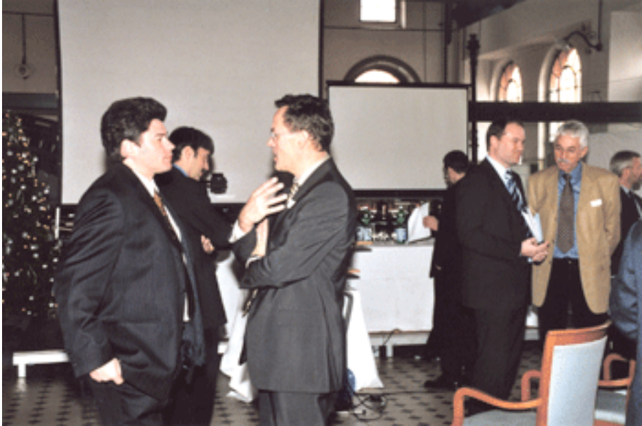
Angeregte Diskussionen nach dem FM-ARENA-Anlass